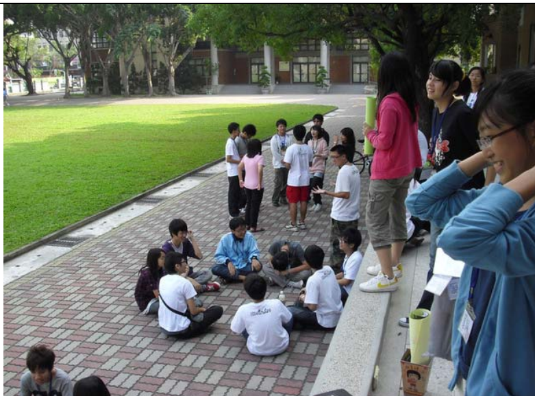
說明：小隊活動 自我介紹 玩團康遊戲