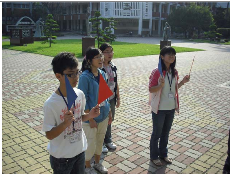
說明：闖關活動 舉紅白旗